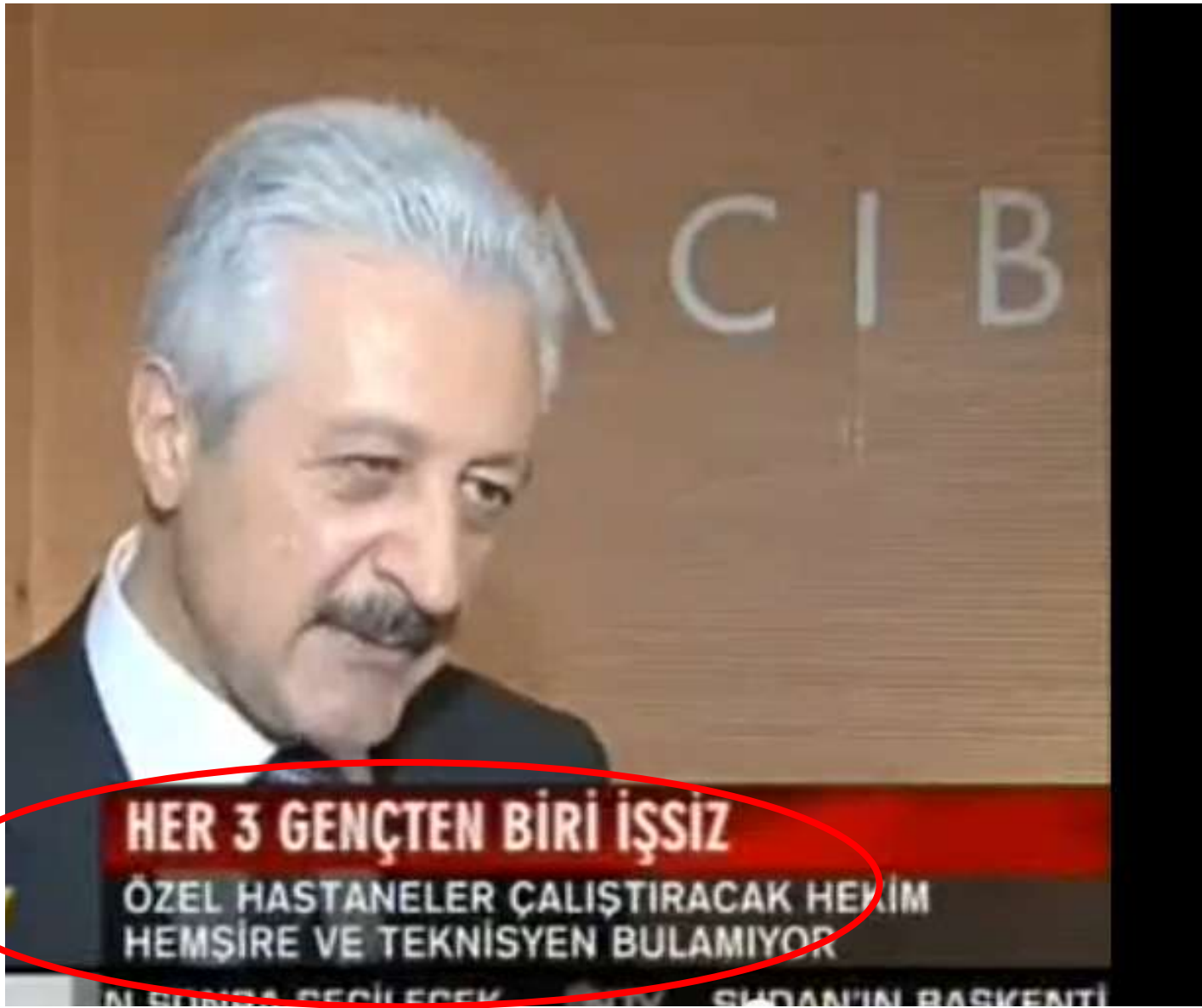
Sağlık Çalışanlarının Sağlığı 3. Ulusal Kongresi